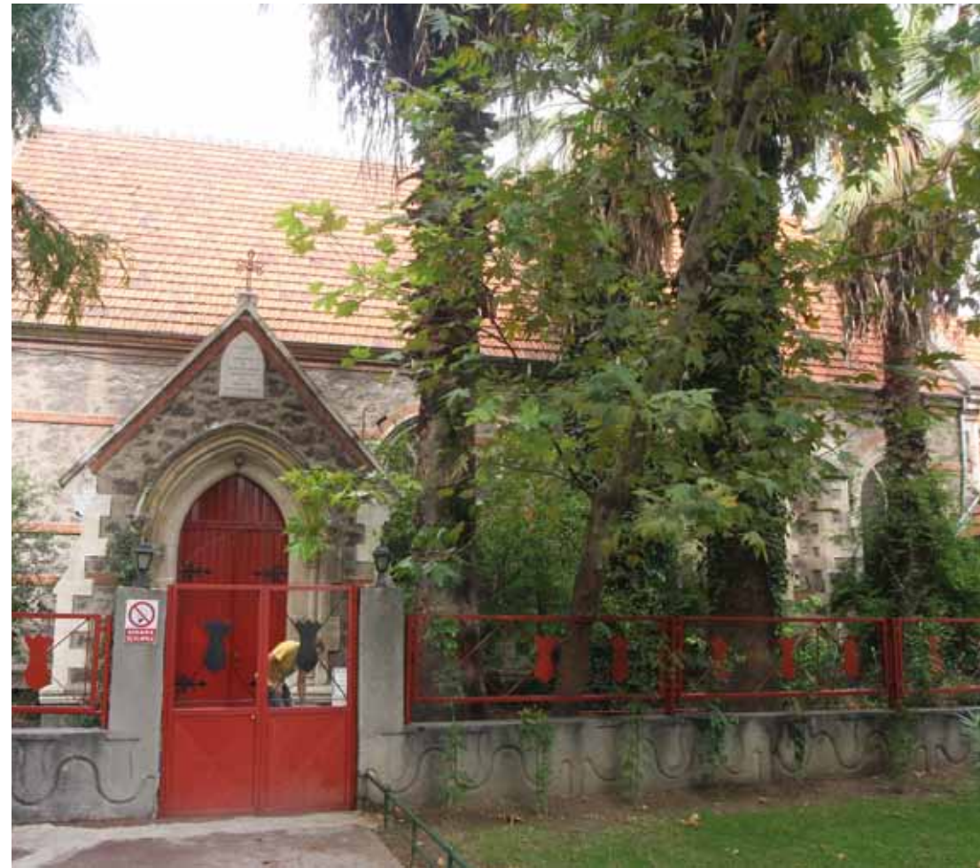
St. John Anglikan Kilisesi St. John Anglican Church

Weiter vorne befindet sich der Mustafa Bey des Stadtteils Alsancak von Izmir mit seinen modernen Cafés, Restaurants und schönen Gebäuden sowie der Kulturpark, die Messe und das Kunsthistorische Museum, die anstelle des abgebrannten Teils von Izmir gebaut wurden. In der Umgebung des Basmane Gar (Bahnhof), der 1876 erbaut wurde, befand sich früher der armenische Stadtviertel mit seinen Webereien, Kirchen, Schulen und Krankenhäusern. Gegenüber dem 26 Ağustos Tor der Messe befindet sich das Krankenhaus in neoklassischer Architektur, das für die Neue Evangelisch-Griechische Schule erbaut, jedoch nie für diesen Zweck benutzt wurde und heute das Gebäude des Namık Kemal Gymnasiums ist und gegenüber des Lozan Tors der Messe befindet sich das Atatürk Gymnasium, die alte Griechische Mädchenschule Parthenogöğü.