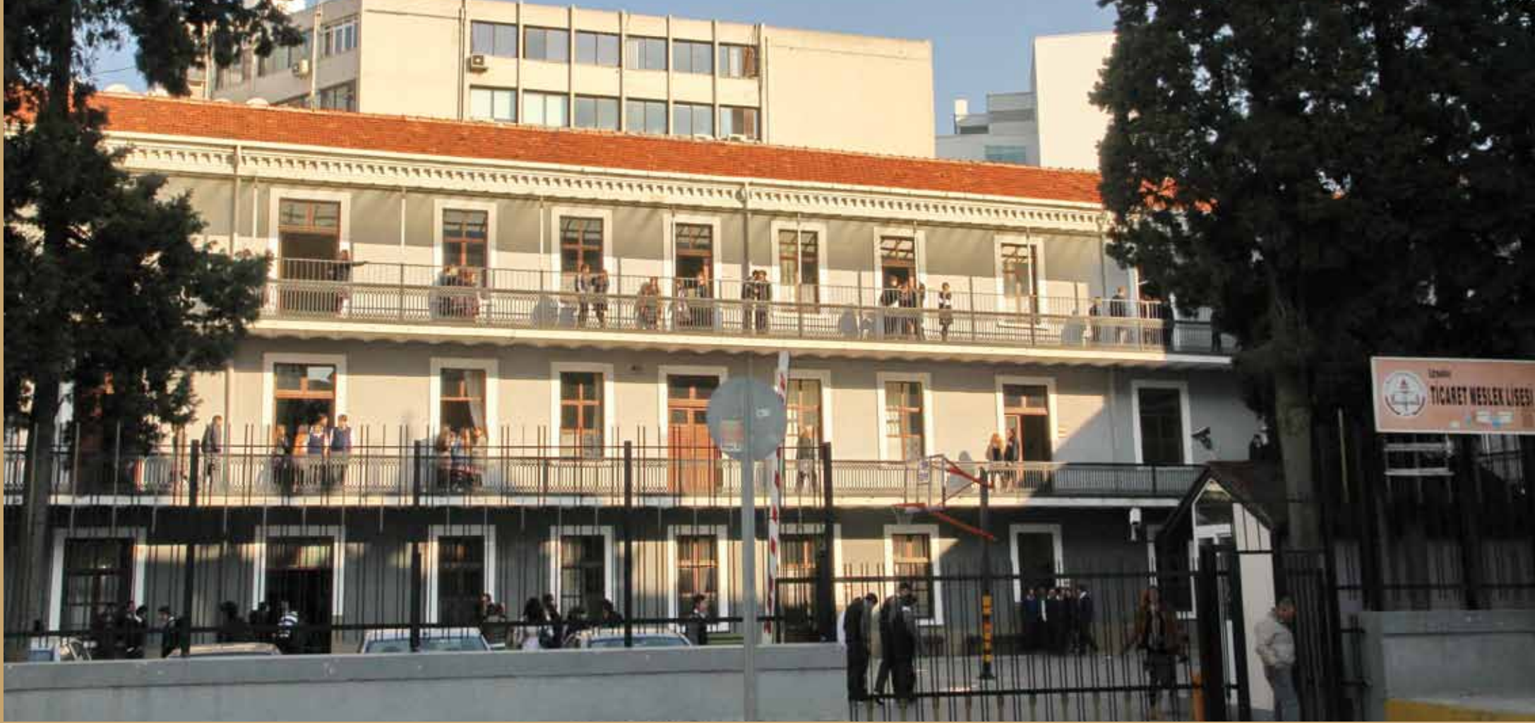
İzmir Ticaret Lisesi ( Commercial College )