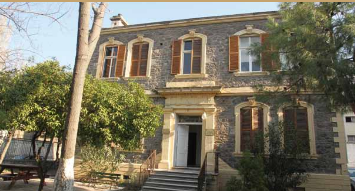
Nevval Salih İşgören Anadolu meslek lisesi Tourism School