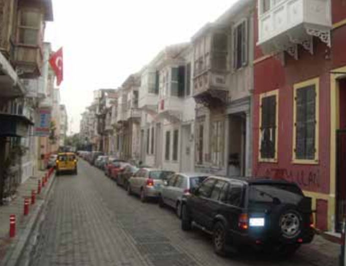
Cumbalı Evler Cumbalı Houses