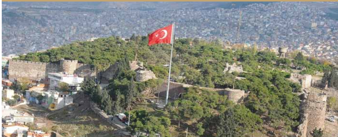
Kadifekale Mount Pagos

Lasciatisi alle spalle la vasta piazza di Konak ed il Palazzo del Governo, la Torre dell'orologio e poi il Museo Archeologico ed Etnografico, anticamente Ospedale Francese St. Roche per la cura della peste, ci si incammina verso il Monte Pagos (Kadifekale). La percurialità del luogo è determinata dal fatto che Lisimaco, generale del famoso re di Macedonia Alessandro Magno pose qui le fondamenta della città di Smirne. E sempre in questo luogo San Policarpo, Santo Protettore di Izmir, fu condannato a morte dai Romani nell'anno 155 e martirizzato nello stadio. Il Governatore di Roma Starzio Quadrato ne ordinò la condanna a morte. Il nome di questa famiglia si ritrova anche a Pergamo.