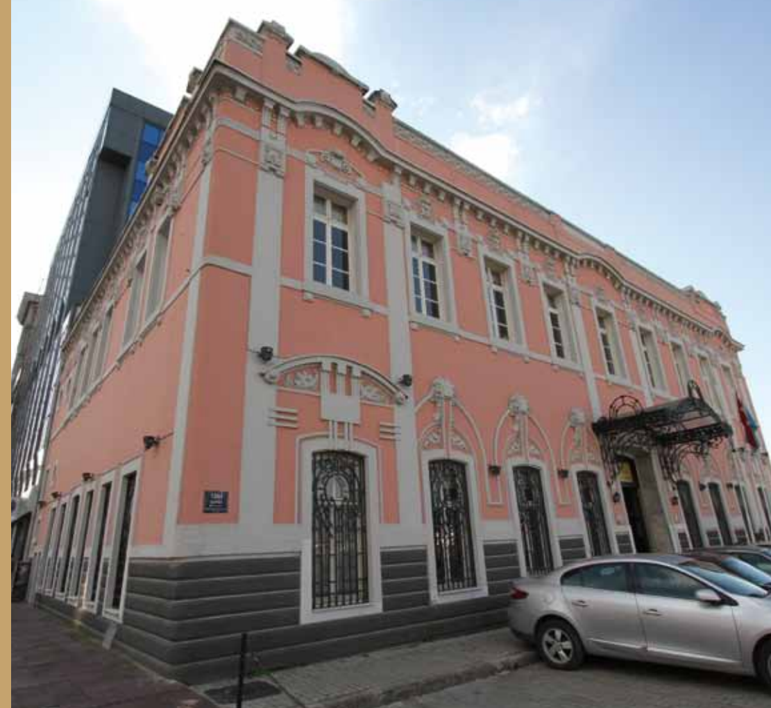
Turizm Müdürlüğü Tourism Office

Leaving Konak beautiful square with the Governor's Palace the Clock Tower and the Archeology Museum as well as the former St. Roche the French Hospital of Plague today Ethnography Museum -you will reach Kadifekale the Mount Pagos. Here the great Alexander's general Lysimachus founded Smyrna. Here also St.Polycarp the saint protector of Izmir was condemned by the Romans to death and died as martyr in the Stadium. This death sentence was given by Starzio Quadrato Governor of Smyrna at that time. We will meet again this family name in Pergamon.