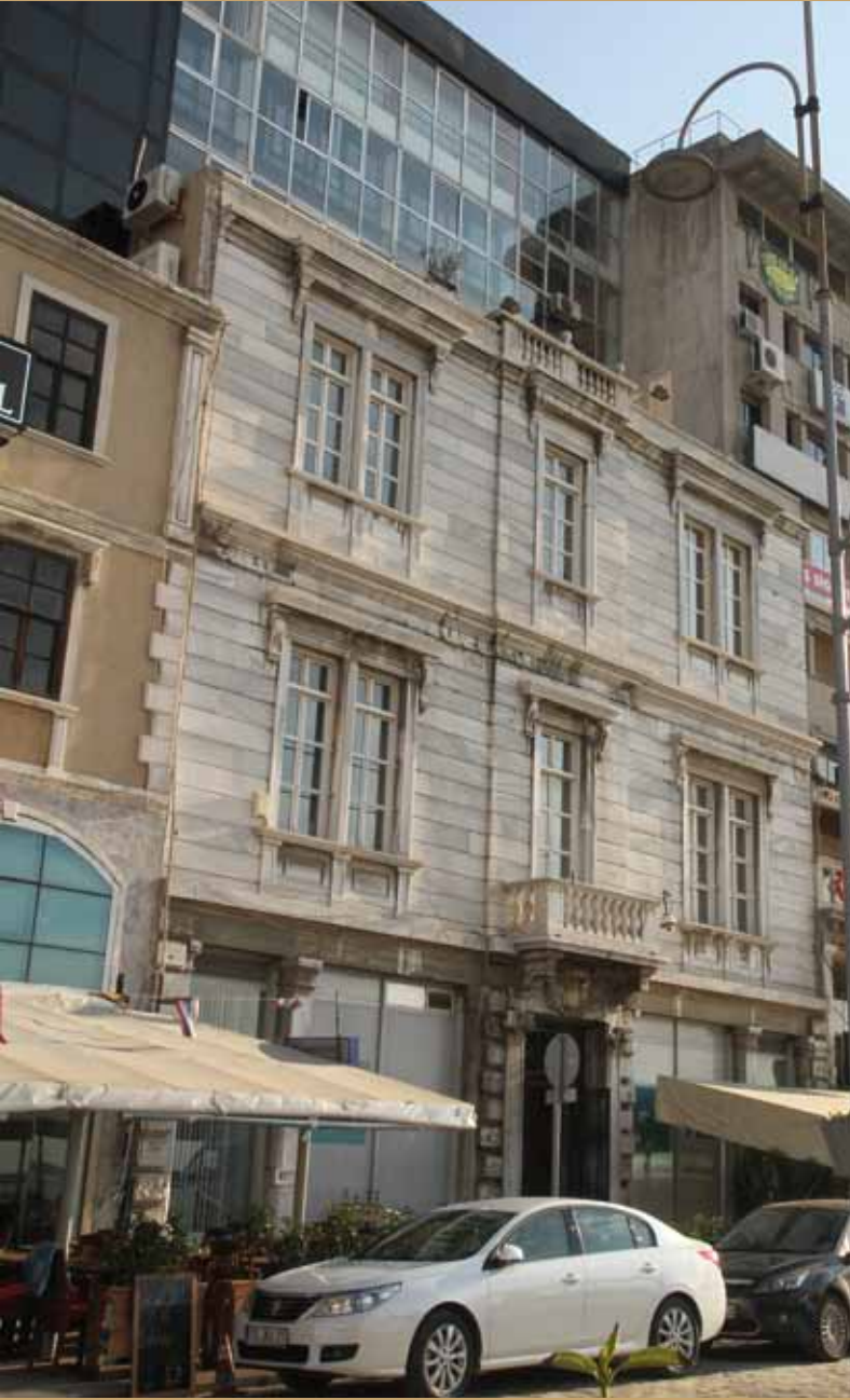
TEB Bankası (Eski Reess Binası) TEB Bank

Tarihsel süreç içinde İzmir'in bir liman kenti olarak önemi her zaman çok büyük olmuştur ve ülkenin ihracatında da XVIII. yüzyıldan bugüne kadar her zaman lider konumunda olmuştur. Osmanlı döneminde Kapitülasyon adı verilen ve bir çeşit ticaret kolaylıklarından ya da ayrıcalıklarından yararlanan Cenevizli, Venedikli, Hollandalı, İngiliz ve Fransız tacirler İzmir'e yerleşip, bölgenin zengin tarımsal ürünleri olan üzüm, incir, pamuk, palamut gibi ürünleri ihraç ediyorlar ve ticaret yapıyorlardı. İskelenin karşısında şimdi TEB Bankası olarak faaliyet gösterilen ilginç yapı, kapısındaki R harfinden de anlaşılacağı gibi, İngiliz tüccar – armator, gemi acenteliği yapan Reesler'e aittir. Avrupadan gelen bu tüccarlar ülkemizde yerleşerek ikinci nesilden sonra bir kültür, din çeşitliliği ve zenginliği ile karşılaşınca, tatlı su frenki anlamına gelen LEVANTEN (Doğulu Avrupalı) hüviyeti ile tanınmışlardı. Eski Liman buralarda idi ve bugün güzel butik ve restoranlar ile ün kazanmış olan, Eyfel bürosu tarafından inşa edilen Konak Pier isimli yapı da eski liman tesislerine ait idi.