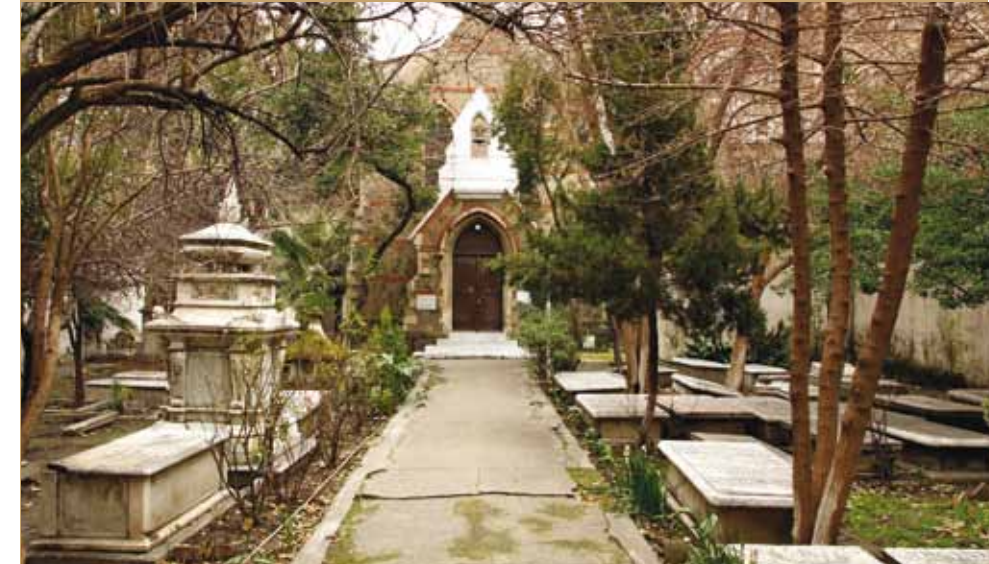
Aya Fotini Kilisesi Church of Aya Fotini