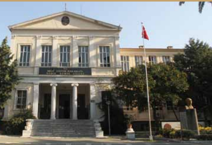
Namık Kemal Lisesi Namık Kemal School