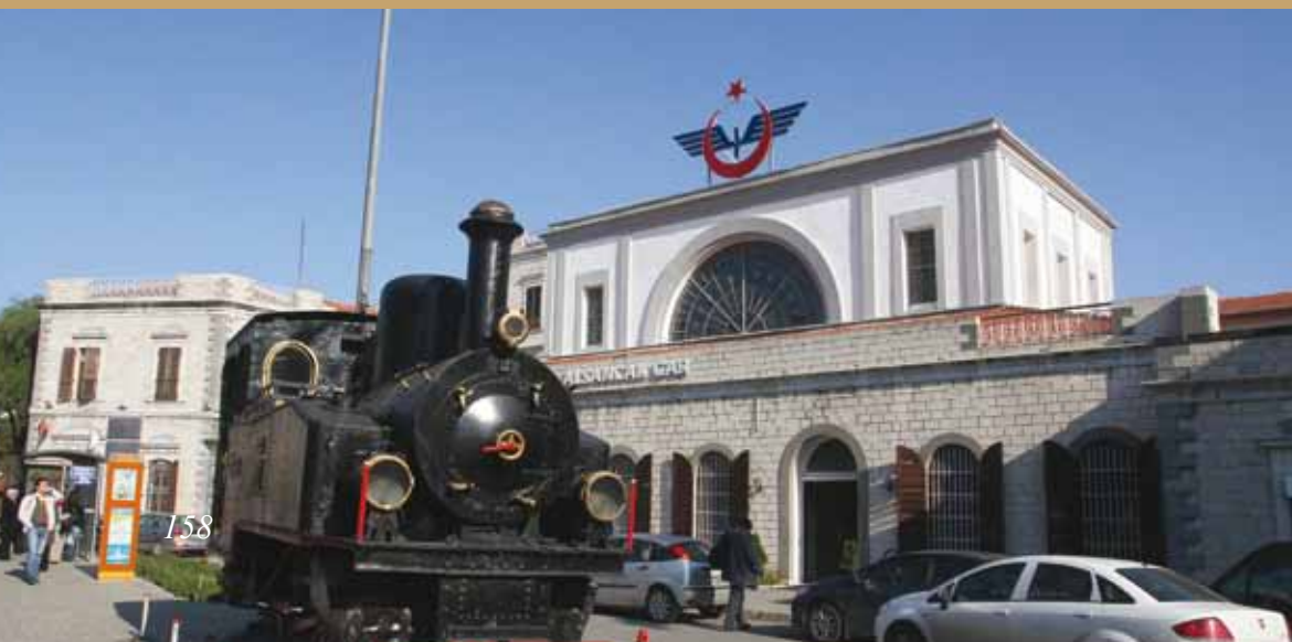
Alsancak Tren Garı Alsancak Railways Station