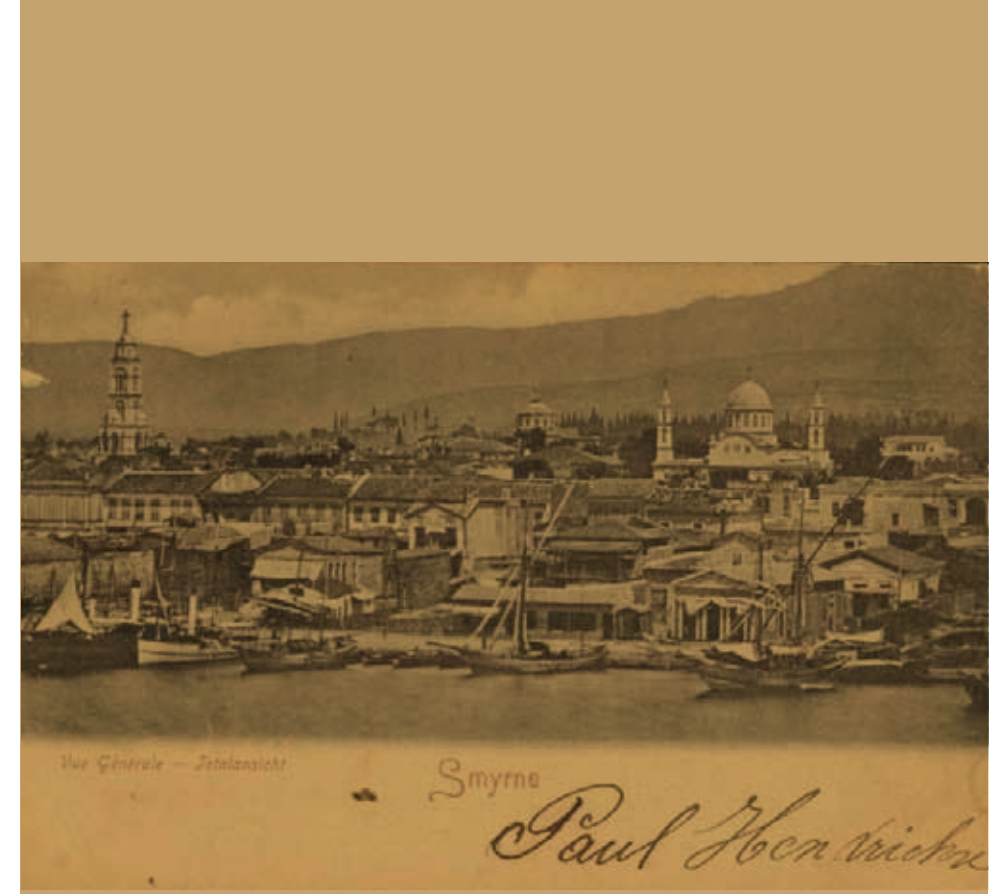
Aya Fotini Kilisesi Church of Aya Fotini

İzmir'de her türlü konfora sahip otellerin, her çeşit restoran ve kafenin bulunduğu Kordon'a ve Pasaport bölgesinde çıktığında İzmir'in oldukça çarpıcı, çok kültürlü, çok dinli geçmişiyle karşı karşıya kalmak mümkündür. Bugünkü Türkiye Cumhuriyeti'ni kuran büyük önder Mustafa Kemal Atatürk'ün İtalyan Canonica tarafından yapılan heykelini gördükten sonra, Konak istikametine doğru yüründüğünde sağ tarafta eskiden bir Gümrük Binası olan ve günümüzde körfezin karşı tarafındaki semt olan Karşıyaka'ya sefer yapan vapurların yaşadığı iskele olarak kullanılan yapı görülebilir.