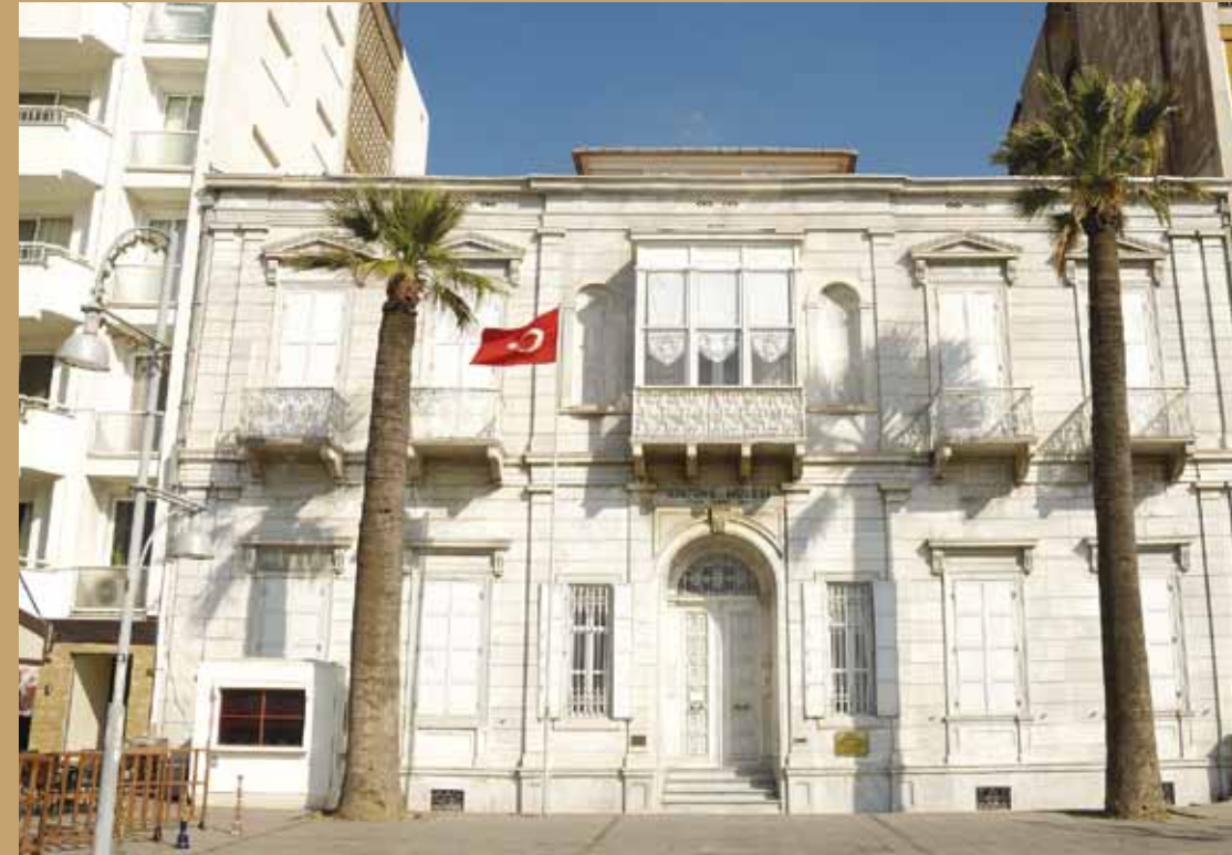
Atatürk Müzesi Atatürk Museum

Nella zona del porto, oggi leader sia in campo commerciale che crocieristico, si trovano la stazione ferroviaria di Alsancak Punta, non più utilizzata come tale, opera architettonica inglese e, di fronte, le case di stile inglese anticamente dimora dei direttori delle ferrovie britanniche, la Chiesa Protestante Anglicana ed il Consolato inglese. E poco oltre si incontra l'edificio che ospitava la compagnia del tabacco (Tütün Rejisi) ed il vecchio ospedale italiano Sant'Antonio, oggi sede della Scuola per il Turismo.