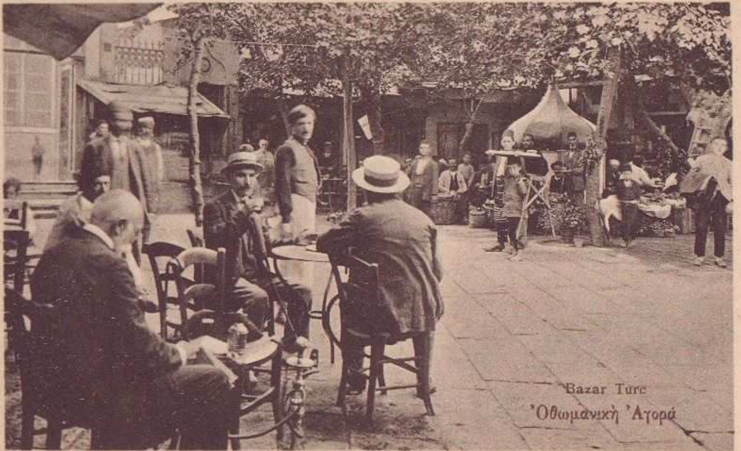
Bazar Turc 'Οθωμανική 'Αγορά