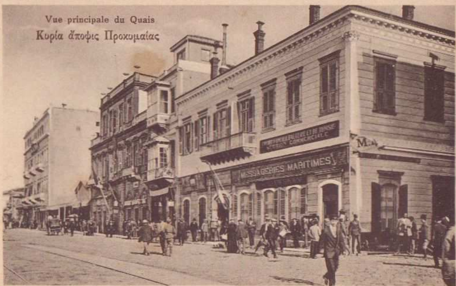
Vue principale du Quais Κυρία ἄποφιν Προκυμαίας