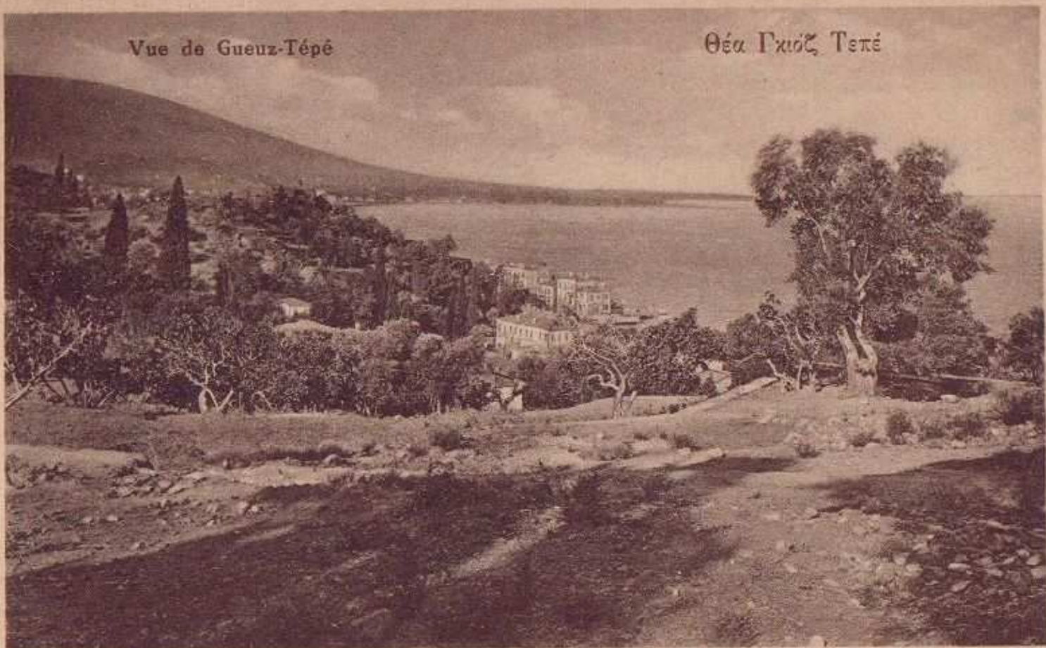
Θέα Γχιόζ Τεπέ